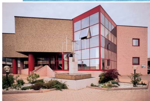
grafico STUDIO ERRE - stampa VALASSORI - Vigevano